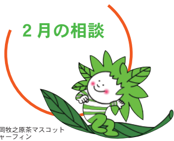
静岡牧之原茶マスコット チャーフィン