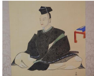
田沼意次侯 肖像画 (牧之原市史料館所蔵)

田沼意次侯の生誕300年を契機に、その功績を顕彰し後世に語り継ぐとともに、市民の誇りの醸成、地域の活性化につなげるため、「田沼再興」の象徴として多くの方々から賛同を募り、全国初となる田沼意次侯の銅像建立を目指します。 銅像は、意次侯が相良藩主となった40歳頃を描いたとされる、牧之原市史料館所蔵の肖像画をモデルとします。 多くの皆様のご協力をお願いいたします。