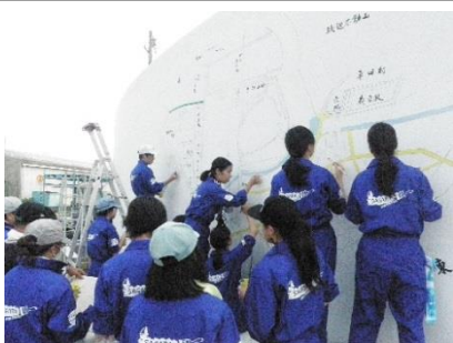
壁画の修復作業に取り組む生徒

色褪せた相良港防波堤の壁画を相良高校美術部の生徒と市民有志で修復しています。年度内の完成予定です。