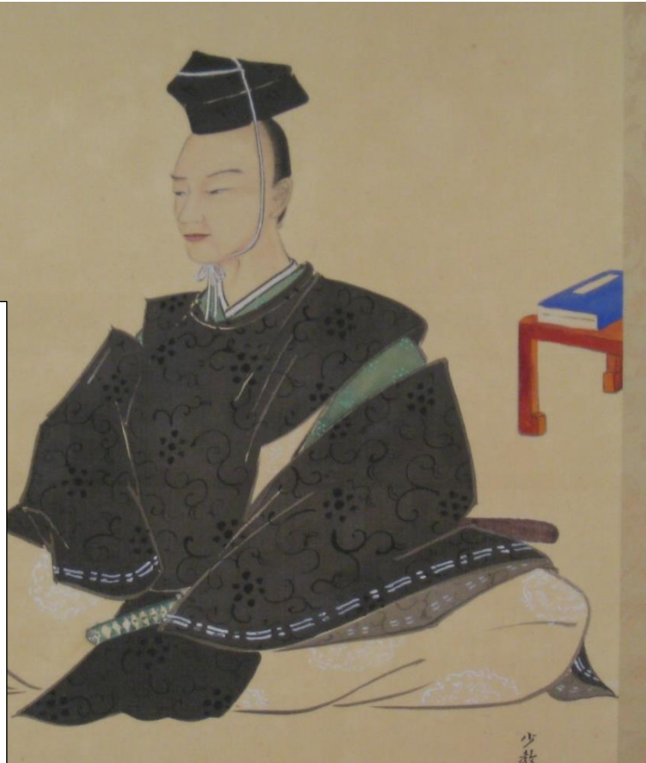
田沼意次侯肖像画 (牧之原市史料館所蔵)