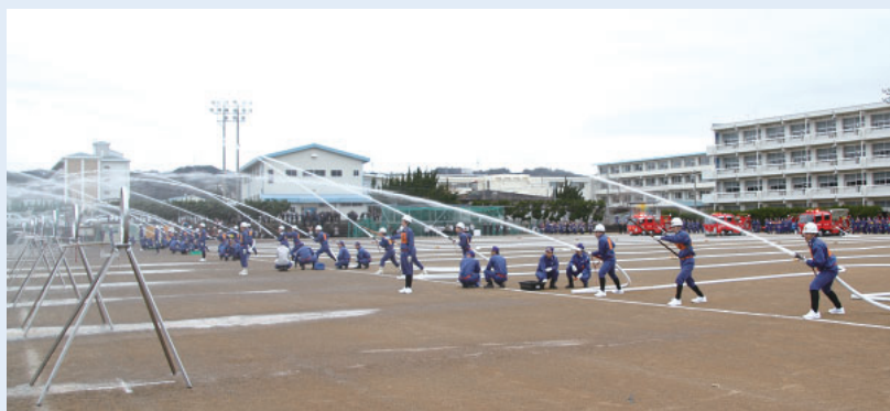
訓練を重ねた操法を披露(前年の様子)

令和2年牧之原市消防団出初め式を執り行います。 日ごろの訓練の成果を発揮する消防操法を披露します。 どなたでも観覧いただけます。 ぜひお越しください。 期日 1月5日(日) 時間 ▼式典 午後1時〜 ▼操法披露 午後2時〜 場所 相良中学校体育館・グラウンド