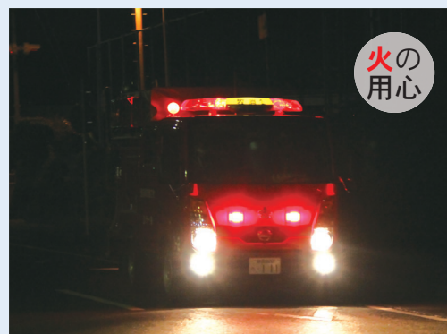
消防車両で地区内を巡視