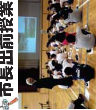
〈川崎小での市長出前授業の様子〉

牧之原市では、市制10周年記念事業として、西原茂樹市長が未来を担う子どもたちに、故郷への愛着を持ち、将来にわたって魅力的なまちを創る思いを持つことができよう、「市長出前授業『未来に夢を持とう！～The Power comes from inside.』」を行っています。