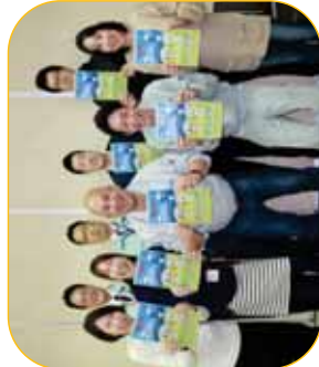
〈子どもたちのため、実行委員は楽しくやっています！〉

この取組により、郷土愛あふれ、市の将来を担う子どもを育てます。詳しくはホームページをご覧ください。 http://www.boku-machi.net