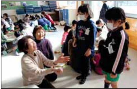
【昔ながらの遊びを学習】

牧之原小学校の自慢の1つが祖父母の会です。会の名の通り、祖父母による組織で、学校のために年間を通してたくさん協力していただきます。1, 2年生は昔の遊びを教えてもらったり、流しそうめんを体験させてもらったりしています。先日は、おはじきやお手玉、けん玉などを一緒にやって、昔ながらの遊び方を教えてもらいました。3, 4年生は芋汁作りです。全国的にも有名な中嶋農園さんのご厚意で3年生が植えさせてもらった自然薯を収穫し、芋汁にして食べます。祖父母のみなさんの手際の良さやお話から多くを