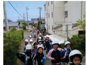
【高台への避難訓練】