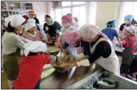
【収穫した自然薯で芋汁づくり】