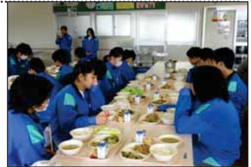
【給食前のキャロット通信読み上げ】

今年は、校内にある学校園でジャガイモ、ナス、ブロッコリー、オクラ、トマトなどの野菜をたくさん作りました。それらの野菜を収穫して、給食に出してもらうこともあります。旬の野菜を楽しむこともできました。