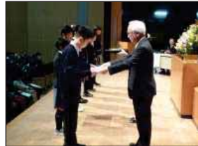
【代表理事から授与される様子】