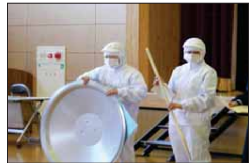
【調理員さんに扮して】