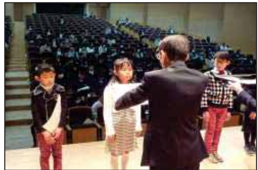
【教育長から授与される様子】