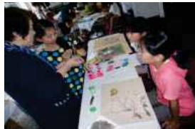
【こて絵教室の様子】

*募集チラシ(くわしい内容)は4月中旬に小学校から配布します。(社会教育課：53-2646)