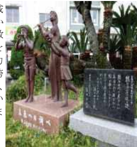
【勝間田小学校 記念碑】