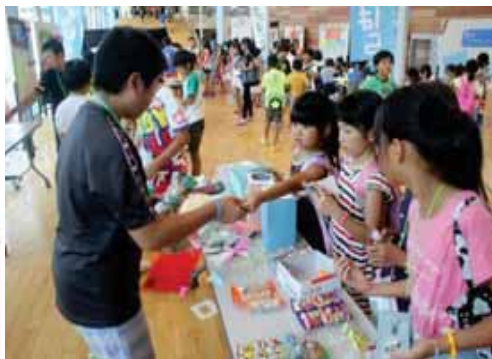
【昨年度の「ぼくまち」の様子】