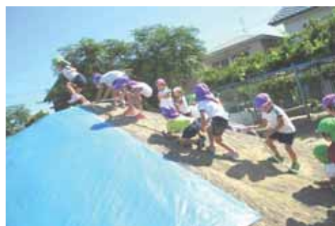
【ロープを使って山登り】