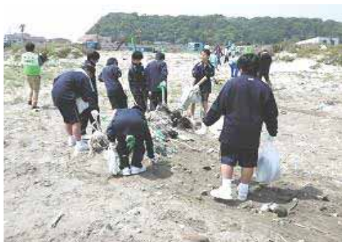
【海岸清掃のようす】