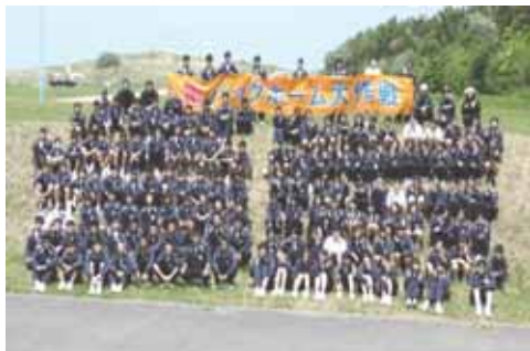
【亀バックホーム大作戦】