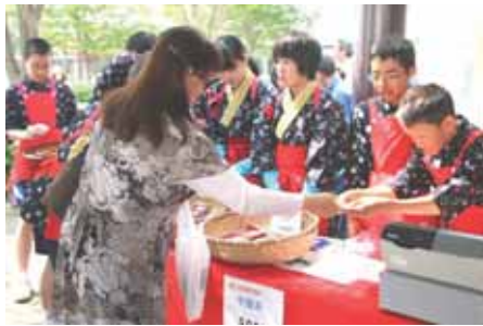
【できあがったお茶を販売】

牧之原中学校長は、「今回の受賞は、これまでの取り組みが認められただけでなく、地域の方々との関わりや七十年にも渡る先輩から受け継いできた取り組みが認められたということなので大変誇らしく思います。これからお茶に関わる活動を大切に継続していきま