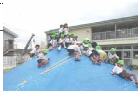
【築山大好きな子どもたち】

試行錯誤して遊ぶ中で、足腰を使って這い上がる、駆け上がる、踏ん張る、バランスを取る、滑り降りる、走り降りるなど、身のこなしがスムーズになりました。子どもたちの体力や運動能力が成長してきていると感じています。また、友達と一緒に遊ぶ中でできなかったことに挑戦したり、お互いに励まし合ったりして心の育ちも見られました。幼児期は遊びが学びです。友達との遊びの中で、心も体も豊かにたくましく成長して欲しいと願っています。