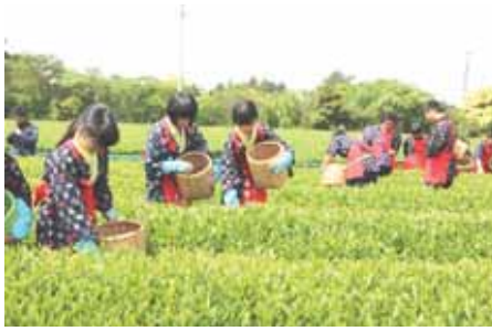
【茶娘・茶息子の姿でお茶摘み】