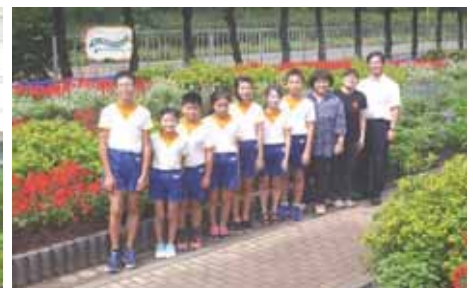
【花いっぱい委員会】