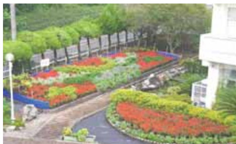
【全校で花壇づくり】

萩間小学校では、全校の力を合わせて花壇づくりに取り組んでいます。まず、五、六年生の「花いっぱい委員会」の子どもと職員が種をまきます。うまく発芽させられるか、そしてその苗を小さなポットにうまく仮植できるかなど、難しい課題に細心の注意を払いながら心を込めて育てています。ボランティア活動を通して、学校中の子どもたちが愛情と時間をかけて育てた苗が、やがて美しく花を咲かせる様子に生命の大切さを学んでいます。 萩間小学校長は、今回の受賞について「これからも花を愛する心、真心を込めて丁寧にかかわる心、命を大切にする心を、花壇づくりを通して大切に育てていきたいと思えます。」と話してくれました。