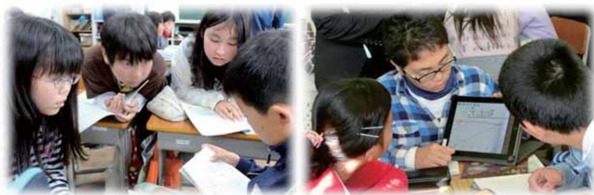
授業の様子（確かな学力推進事業・ICT活用推進事業）

自己点検・評価シートの様式は、市が総合計画等の進捗状況を確認、評価する際に使用している様式をできる限りそのまま使用し、市の評価と整合が図れるようにしています。