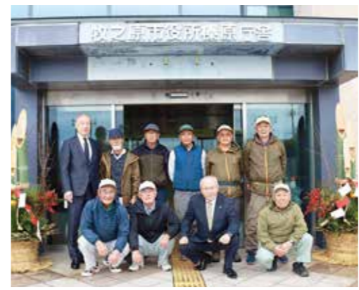
年末に市役所両庁舎に門松を寄贈