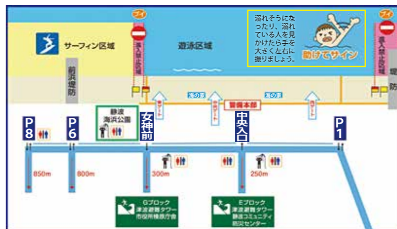
◀さざんかサンビーチ避難経路