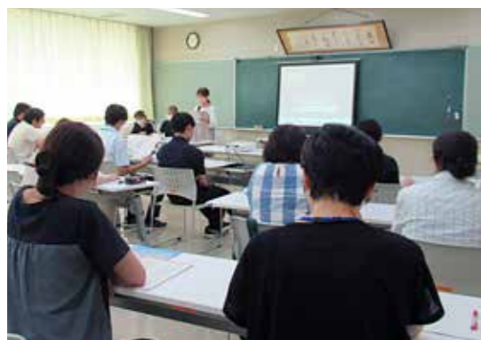
市役所職員を対象とした講座

※いずれも午前9時30分から開始ですが、回により終了時間が異なります。（おむね午後5時前後）