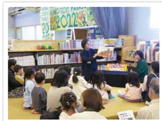
▲毎月開催している「おはなし会」にて、読み聞かせを聞く子どもたち

読書が強制的ではなく、子どもが自分の意志で自由により行われること(自由読書)を前提に、子どもが「本を読みたい」と思った機会を逃さないよう、関係機関が読書環境を整えておきたいと考えるものです。