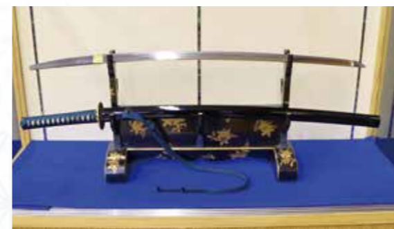
▲クラウドファンディングにより購入した名刀「七曜霊光(正清)」 *今回決定した「号」は単独、または刀工である「正清」を加えた「七曜霊光正清」として活用。