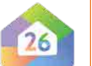
住宅省エネ 2026キャンペーン

新築とリフォームを対象にした、4つの補助事業により、家庭部門の省エネ化を促進します。一部の 新築住宅 を除き、子育て世帯に限らず 全ての世帯 が対象になります。