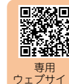
専用ウェブサイト

[参加募集期限] 12月9日 [問い合わせ] 静岡県 みんなのおうちに太陽光事務局 ☎0120(723)100 *受付時間：午前10時～午後6時(土・日・祝日を除く)