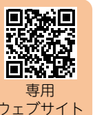
専用ウェブサイト

[参加募集期限] 事業内容によって時期が異なります。詳細はウェブサイトをご確認ください。 [問い合わせ] 住宅省エネ2026キャンペーン 補助事業合同お問い合わせ窓口 ☎0570(081)789 *受付時間：午前9時～午後5時(土・日・祝日を含む)