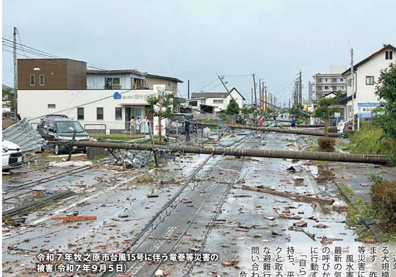
令和7年牧之原市台風15号に伴う竜巻等災害の被害(令和7年9月5日)

近年、全国各地で局地的豪雨や台風による大規模な風水害、土砂災害が発生しています。昨年は本市でも台風15号に伴う竜巻等災害により多くの被害が発生しました。風水害や土砂災害から身を守るためには最新の気象情報などに注意し、市から避難の呼びかけがあったときには、正しく迅速に行動することが重要です。