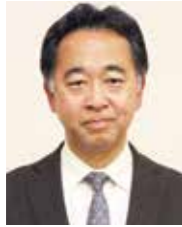
牧之原市副市長 櫻井 剛

【プロフィール】 1972（昭和47）年牧之原市生まれの53歳。明治大学卒業。平成9年静岡県庁奉職。産業政策課産業政策班長、商工振興課課長代理、産業政策課参事、産業政策課長を歴任し、令和8年4月1日に牧之原市副市長に就任。任期は4年間。