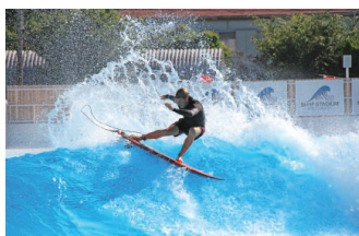
静波サーフスタジアム