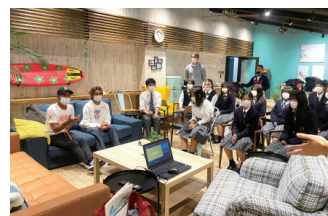
サーフシャック (静波スウィングビーチ内)