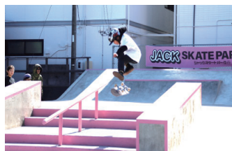
ジャックオーシャンスポーツ (スケートボード場)