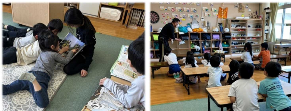
放課後児童クラブのようす

今後も、共働き家庭の増加等による保育ニーズの高まりに対応できるよう、受け入れ体制の維持・拡充に努めます。