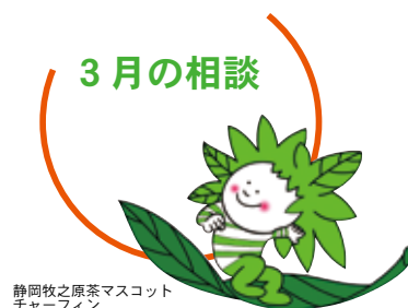
静岡牧之原茶マスコット チャーライン