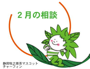
静岡牧之原茶マスコット チャーライン