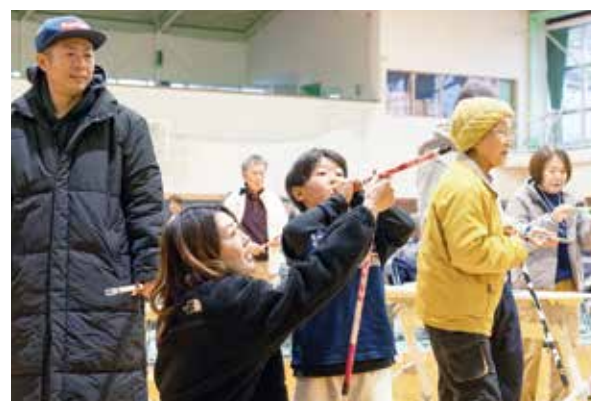
市内業者が開発した吹き矢で的を狙う参加者

なお、使用された道具は、矢の先端が磁石で的が鉄板になっており、市内業者が改良を重ねて開発したものです。