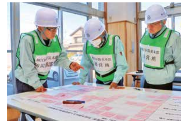
グループごとに課題や対策を書き出す細江区の本部役員