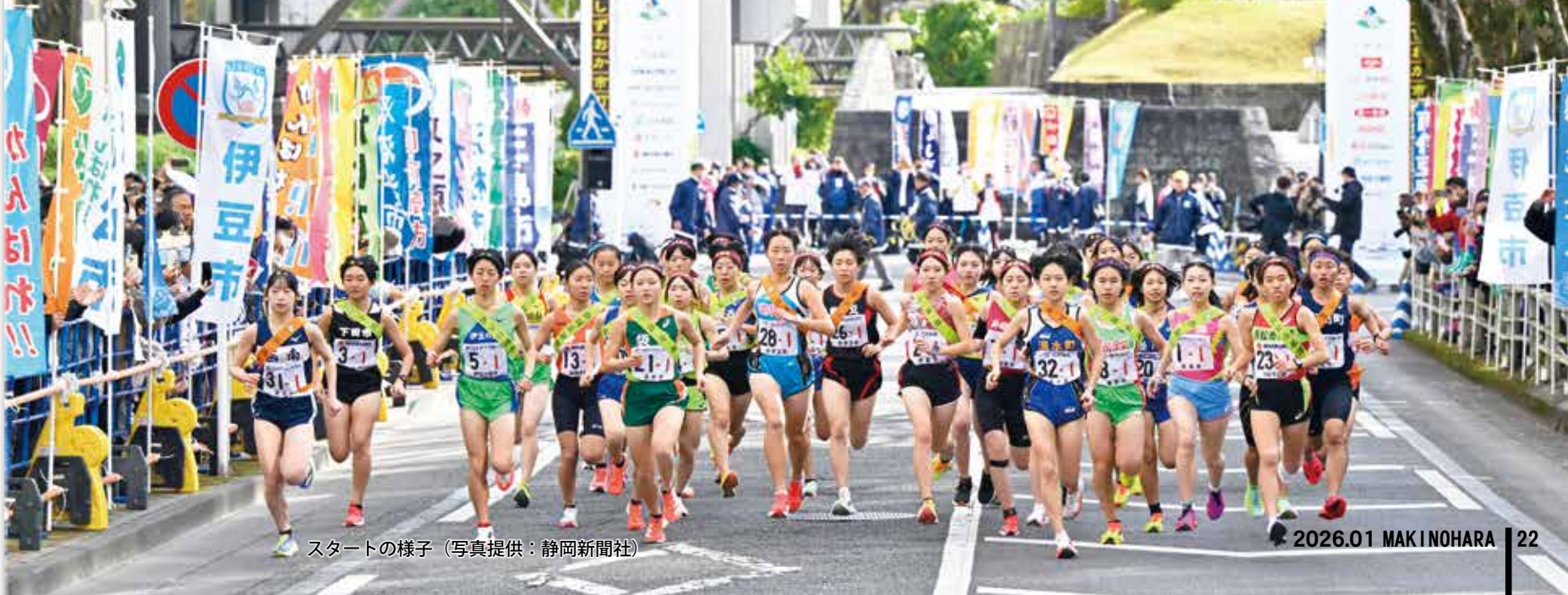
スタートの様子