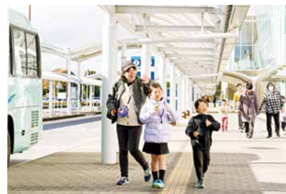
バスで空港を楽しむ参加者

参加者は自主運行バスなどを利用し、富士山静岡空港とふじのくに茶の都ミュージアムを周遊。空港では、飛行機や空港での仕事について学び、普段入ることができない制限区域や、石雲院展望デッキから飛行機の離着陸を見学しました。