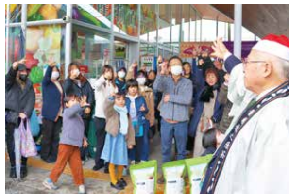
杉本市長とのじゃんけん大会では、多くの参加者が一喜一憂