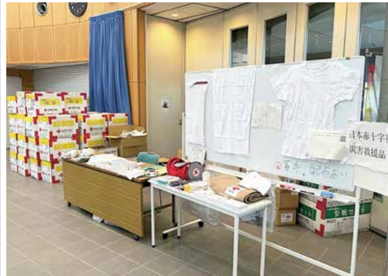
▲毛布約1,100枚やタオル約2,000枚などが届き、災害救援品として配布されました