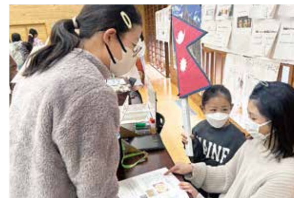
ワールドフェスティバルにて、ネパールについて発表する児童

10代から60代までの20人が参加し、カードに書いてある題目についてグループで語り合い、異なる世代や性別の意見を聞くことで、多様な社会において新たな価値観を広げる機会となりました。