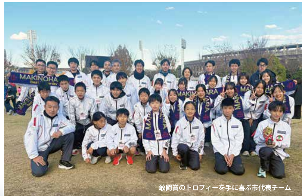
敢闘賞のトロフィーを手に喜ぶ市代表チーム