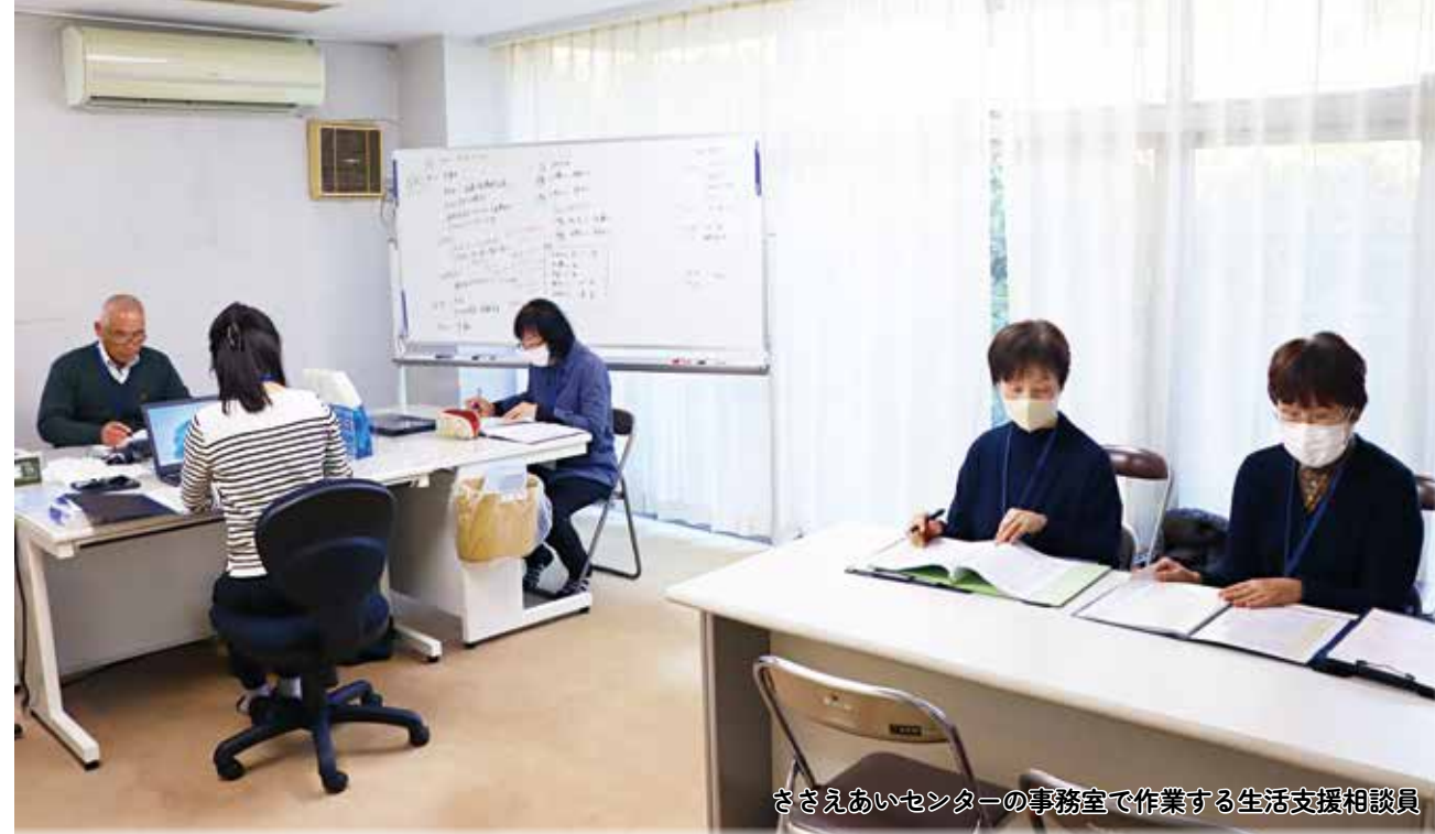
ささえあいセンターの事務室で作業する生活支援相談員

▶ 内閣府「つなぐ窓口」 ☎0120(262)701 ▶ 県障害者差別解消相談窓口 ☎054(252)9800 ▶ 市社会福祉課障害者支援係 ☎③0072 ▶ 生活支援センターやまばと ☎②90223 ▶ 生活支援センターつばさ ☎③2610 ▶ 相談室こころ ☎②5529