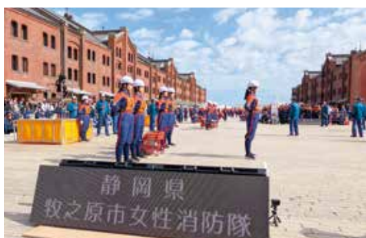
▶一隊5人で操法を実施

「第26回全国女性消防操法大会」が10月28日、横浜赤レンガ倉庫で開催され、静岡県代表として市消防団女性消防隊が「軽可搬ポンプ操法」に出場しました。