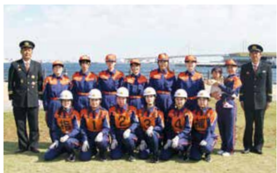
▶大会後の達成感に満ちた顔を見せる女性消防隊員