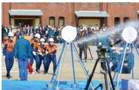
▶放水により標的2個を倒す

ンガ倉庫で開催され、静岡県の代表として市消防団女性消防隊が「軽可搬ポンプ操法」に出場しました。初出場となった本隊は、令和6年5月から計60回以上の訓練を実施し、訓練の成果を十分に発揮しました。惜しくも入賞とはなりませんが、堂々とした操法を披露。大いに奮闘し、最高のチームワークを見せてくれました。今後とも訓練で得た技術や経験を生かし、消防団活動に一層励んでいきます。