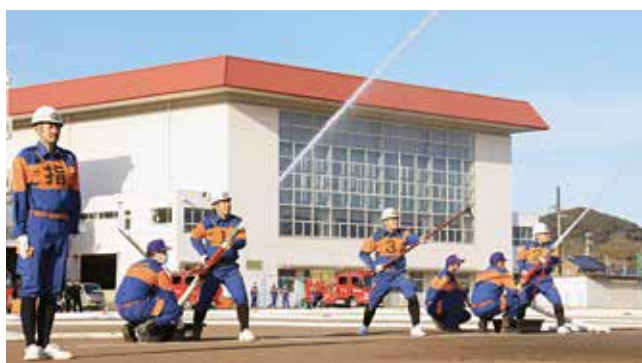
▶出初め式での放水(今年の様子)

A 地域や仲間とのつながりができます。学生時代の同級生や先輩・後輩と再会したり、消防団を通じて新しい仲間ができたりします。