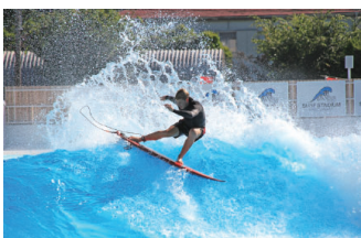
静波サーフスタジアム