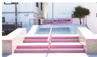
ジャックオーシャンスポーツ (スケートボード場)