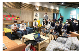
サーフシャック (静波スウィングビーチ内)