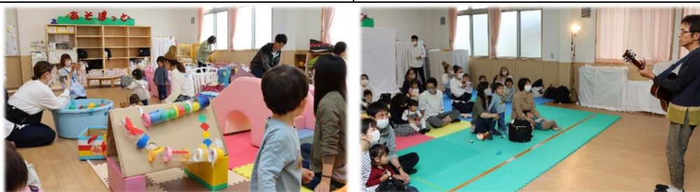
子育て支援センター相良「あそぼっと」のようす