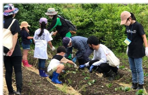
自然体験教室 のようす