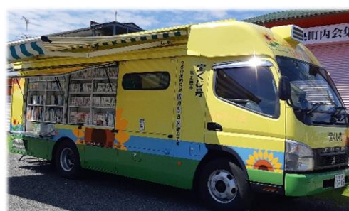
移動図書館 「ひまわり号」