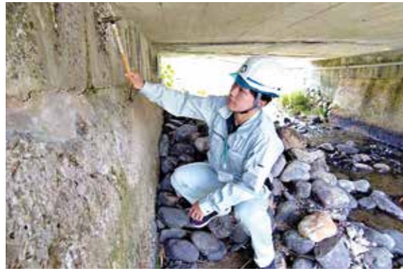
【土木技術員】橋梁点検で損傷状況を確認

市ホームページで公開しています。 また、一般事務（大卒）などの「一般募集枠」などについては、詳細が決定次第、広報紙やホームページ、市公式LINEなどで案内します。