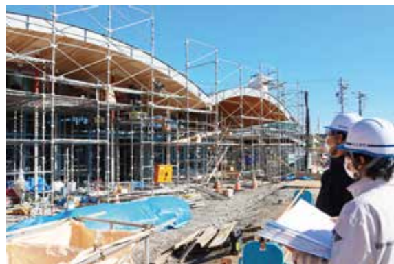
【建築技術員】建築物の施工管理（写真は道の駅）