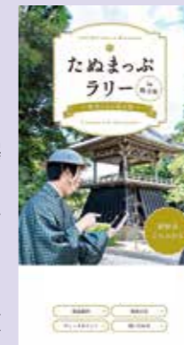
▲スマホ版画面(イメージ)

その他にも、静鉄バス「特急静岡相良線」へのラッピングや市内運送業者のトラック荷台へのプリントによる意次侯ゆかりのまちのPR、「しずおか遺産(地域の歴史的魅力や特色を通じて県の歴史文化を語るストーリーとして県知事が認定する制度)」の認定申請、大河ドラマゆかりの他県自治体との連携・交流などを予定しています。