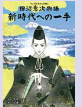
▶田沼意次物語～新時代の一手～

【時期】 1月～ 【Web】 ショート版(約1分) 【デジタルサイネージ】 (意次侯ゆかりの寺院など) 本編(約7～8分)