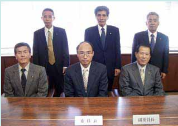
広報特別委員会メンバー