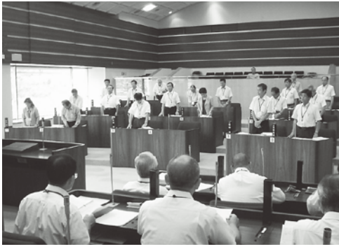
「榛原総合病院の再建に関する決議」が、 全員賛成で可決された

各常任委員会での慎重な審査を経て、原案どおりすべて可決されました。 なお、一般質問は16、17日の2日間行なわれ、11人が当面する課題について見解をただししました。