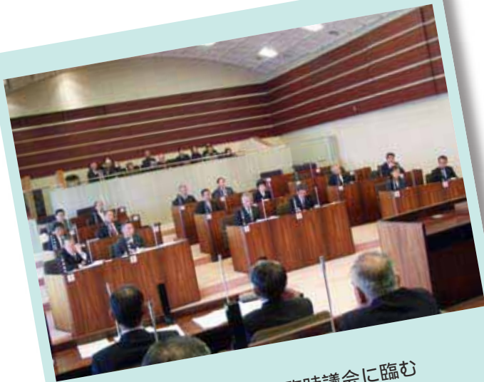
17名の新体制で臨時議会に臨む