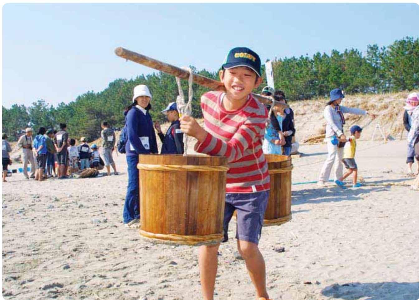
国民文化祭塩作り体験!!