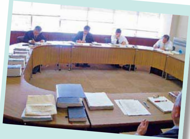
新人議員4名で議員研修会を開催