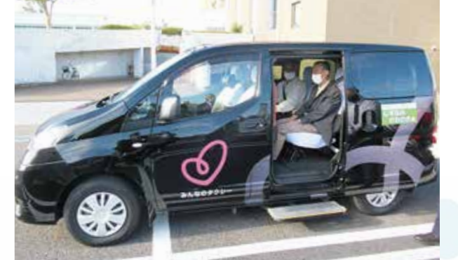
市内全域に導入しているデマンド乗合タクシー

昨年度までの実績を踏まえて、より利用しやすいように曜日などの変更をしました。また、利用促進のためサロンなどでの説明会を実施しております。