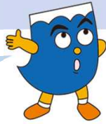
牧之原市河川洪水ハザードマップ(最大規模)より