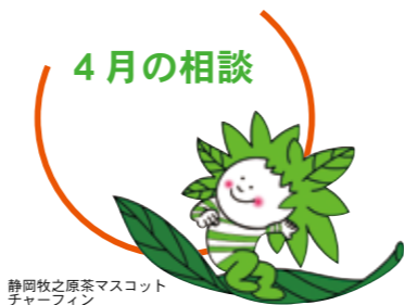
静岡牧之原茶マスケットチャーフイン

4月の相談日です。日々の生活の中で、誰かに相談したいと思っ... 秘密は厳守されますので、ひとりで悩まず、まずは相談してみ... てはいかがですか。