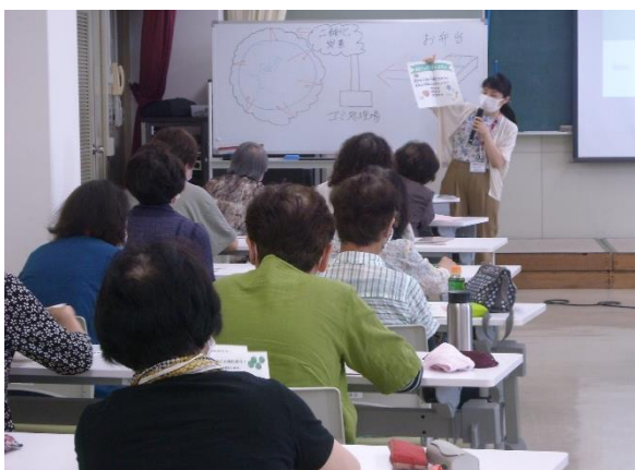
市民学習推進事業（中央セミナー）の様子

自己点検・評価シートの様式は、市が総合計画等の進捗状況を確認、評価する際に使用している様式をできる限りそのまま使用し、市の評価と整合が図れるようにしています。