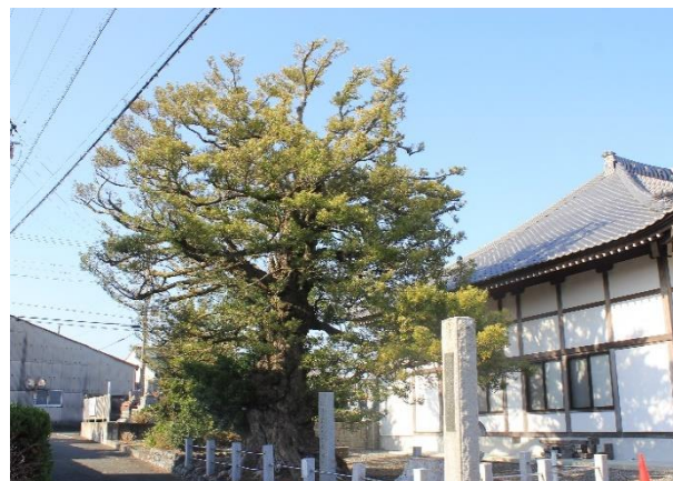
指定文化財修復保存事業費助成事業で剪定を行った掉月庵の夫婦榎（県指定天然記念物）