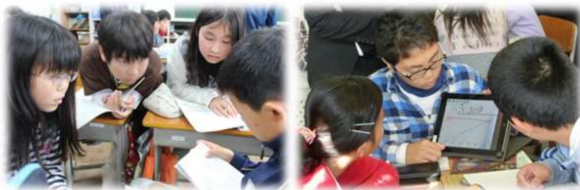
授業の様子（確かな学力推進事業・ICT活用推進事業）

自己点検・評価シートの様式は、市が総合計画等の進捗状況を確認、評価する際に使用している様式をできる限りそのまま使用し、市の評価と整合が図れるようにしています。