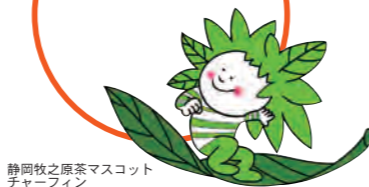
静岡牧之原茶マスケットチャーマイン