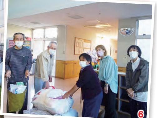
1 救急法短期講習でAEDの使用方法を学ぶ団員 2 減災セミナーにて、赤十字講習指導員から緊急時の対策などを学ぶ団員 3 榛原中学校での防災教育で行った、包装食袋を使用した炊き出し指導 4 さがらサンビーチの清掃活動は、静岡県青少年赤十字高校生メンバーや地域の皆さんと活動 5 榛原総合病院での奉仕作業 6 市内福祉施設へ慰問品を寄贈