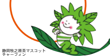
静岡牧之原茶マスケット チャーマフィン