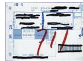
(宅配便の伝票など)