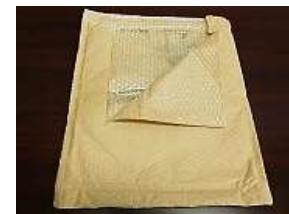
(通販用緩衝封筒など)