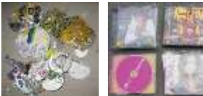
石、ガラス、土砂、 金属(工具、機械部品を含む) 木片、布類、プラスチック類