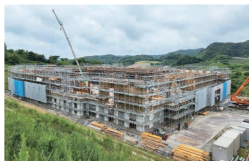
建設工事中の市多目的体育館

称) さかべ」の整備推進事業や、15キロの海岸線を生かした沿岸部活性化事業を進めることで、関係人口や交流人口の増加を図り、移住定住促進補助事業と絡めて、さらなる定住人口の確保につなげていきます。