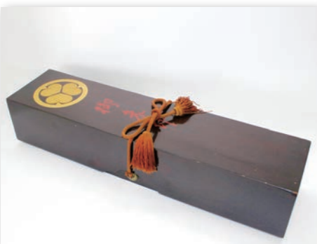
▶ 葵紋入り御朱印箱（大江八幡宮所蔵）

企画展の開催に合わせて、入城券をリニューアルします。なお、旧デザインの御城印も引き続き購入可能です。