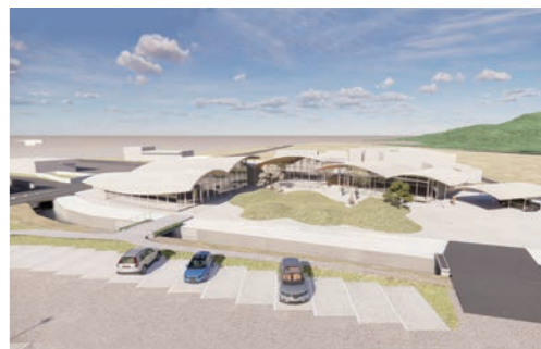
「道の駅（仮）さかべ」完成イメージ

令和5年度当初予算は、合併以降最大規模の227億3千万円と将来都市像の実現に向けた「未来創造型予算」となりました。その中でも、重点戦略・プロジェクトとして取り組む主要事業について説明をしました。 まず、「富士山型ネットワークの充実」では、相良牧之原インターチェンジ北側整備事業について、令和8年度のまちびらきを目指し、土地区画整理組合による事業が本格的に進みます。また、「道の駅（仮