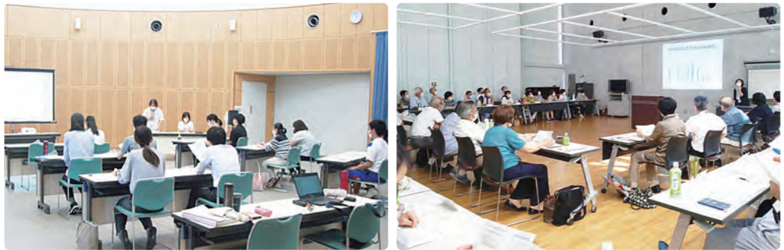
ゲートキーパー養成講座の様子

心でしっかり聴く力も大切ですが、SOSに気付く力も大切です。市では地域や会社などを対象に「ゲートキーパー養成講座」を行っています。ゲートキーパーとは悩んでいる人に「気付き」「声をかけ、話を聴いて」「必要な支援につなげ」「見守る」人のことです。周囲の人の言葉を聞いて変化に気付くポイントや、その後の接し方などについて紹介しています。受講