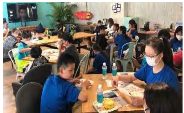
〈第1回英語Webレッスン〉