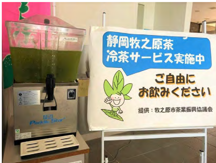
さざんかに設置の冷茶機