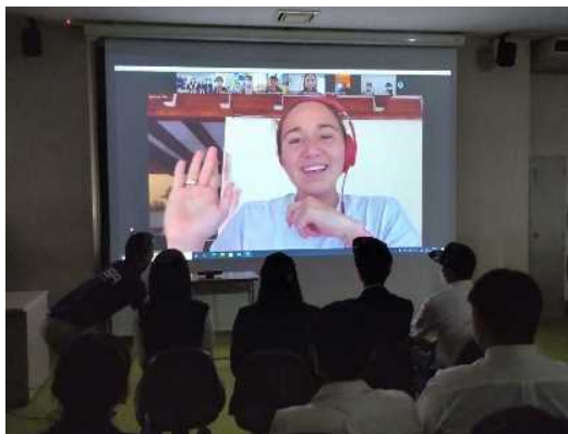
〈カリッサ選手と相高生とのWeb交流〉