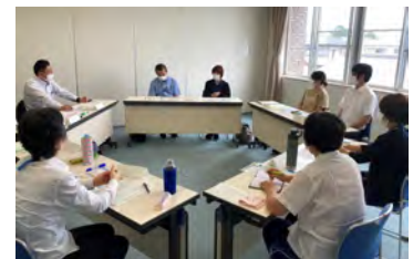
▲7月5日に開催した 事業所座談会の様子