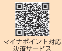
マイナポイント対応 決済サービス

申請する決済サービスによっては期限が短い場合があります。申請の際は注意してください。 決済サービスの申込期限は、右の二次元コードから確認ができます。