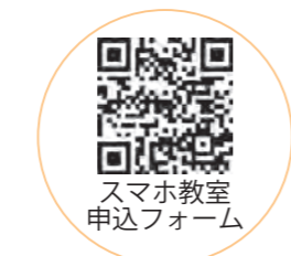
スマホ教室 申込フォーム

申込方法 デジタル推進課に、電話・FAX・申込フォームのいずれかで申し込みください。 *申し込みの際に、名前、参加会場、連絡先をお伝えください。 ▶電話＝☎0033（平日の午前8時15分～午後5時） ▶FAX＝☎0039