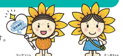
コーケンくん ミーホちゃん

特定健診を受診した人で、生活習慣の改善が必要なときは、保健師・管理栄養士のサポートプログラムを無料で受けられます。 次の健診まで、健康的な体を維持しましょう。