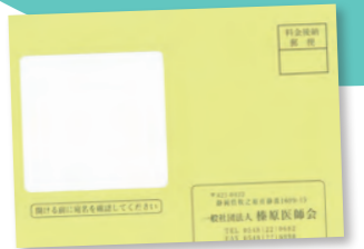
▲特定健診受診券は 黄色い封筒が目印です