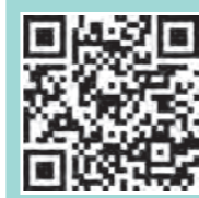
特定セット検診 予約フォーム

*特定セット検診予約フォームでの申し込みについて、不明な点は健康推進課までお問い合わせください。