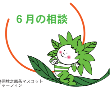
静岡牧之原茶マスコット チャーフイン

5月8日以降、マスクの着用は任意としますが、体温測定などの実施については引き続きご理解、ご協力をお願いします。また、体温が37.5℃以上ある場合のほか、咳症状や倦怠感などがある場合は、相談を見合わせていただきます。