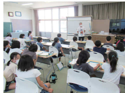
学校での講座の様子

認知症は、誰にでも起こり得る脳の病気です。家族や親戚、近所の身近な人などに認知症サポーターを多く育てることで、認知症になっても過ごしやすい地域づくりを目指しています。 認知症サポーターは、認知症に関する正しい知識を持ち、理解して、手助けをする人のことです。令和5年3月現在、4千781人のサポーターが誕生しています。過去の参加者からは、「認知症が身近にあることに気づいた」「認知症の人の接し方が分かった」「認知症の人の気持ちも分かった」