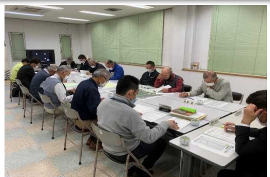
▲四役会を 37 回、役員会を 36 回実施（発行時）