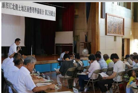
▲第 2 回総会の様子