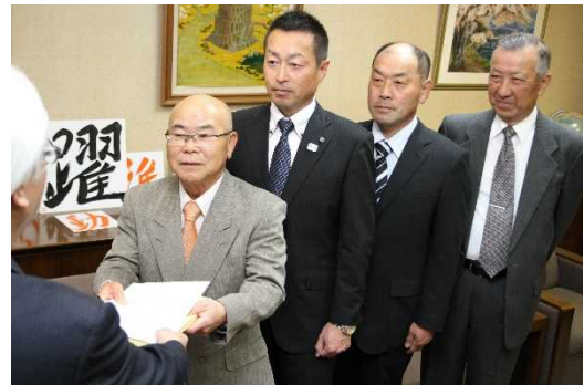
▲市に技術援助申請する四役（同年 4 月）