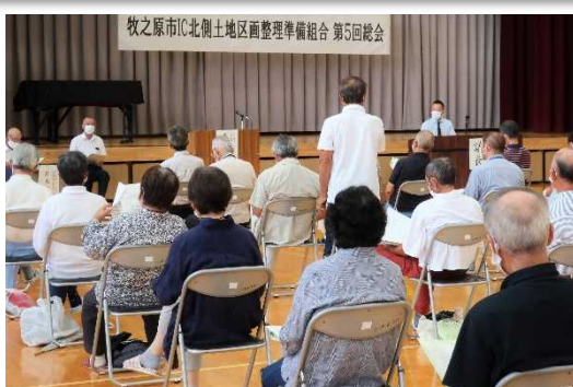
▲第 5 回総会の様子