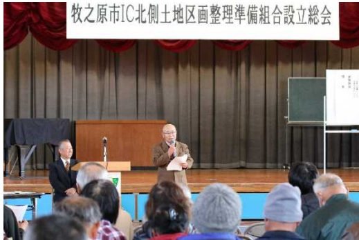
▲設立総会（平成 29 年 2 月 26 日）