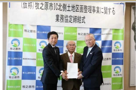
▲三者による業務協定