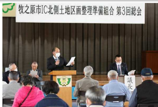
▲第 3 回総会の様子