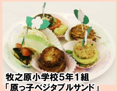
牧之原小学校5年1組 「原っ子ベジタブルサンド」