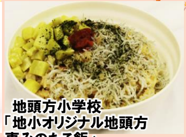
地頭方小学校 「地小オリジナル地頭方恵みのたこ飯」