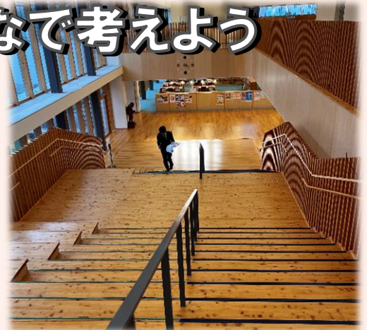
↑検討会で先進地視察をした 愛知県瀬戸市立にじの丘学園

子どもたちが学びやすく、生活しやすく、地域の人も利用できる学校施設をつくろうと、市民のみなさんと一緒に学校施設について検討するための「新しい学校づくり検討会」を設置しました。この検討会は、専門家や、小中学校及び就学前の子どもを持つ保護者の代表、学校関係者、自治会代表、企業の代表から構成しています。検討会では、学校のコンセプト、教室や体育館等の数や機能、通学方法などを検討していきます。