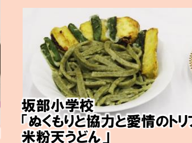
坂部小学校 「めくもりと協力と愛情のトリプルアタック！米粉天うどん」