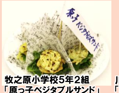
牧之原小学校5年2組 「原っ子ベジタブルサンド」