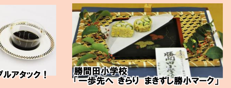
勝間田小学校 「一歩先へ きらり まきずし勝小マーク」