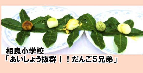
相良小学校 「あいしょう抜群！！だんご5兄弟」