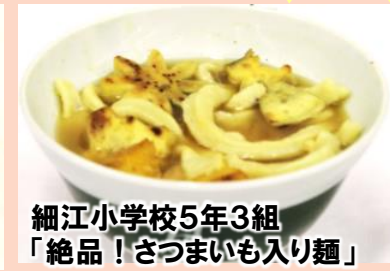
細江小学校5年3組 「絶品！さつまいも入り麺」