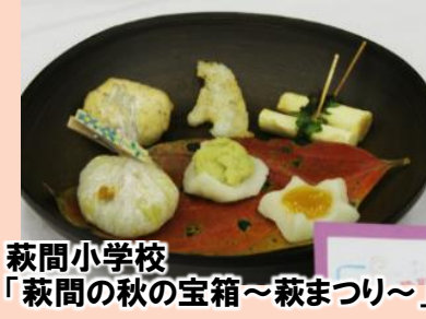
萩間小学校 「萩間の秋の宝箱～萩まつり～」