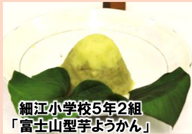
細江小学校5年2組 「富士山型芋ようかん」