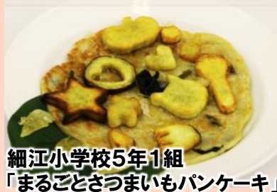
細江小学校5年1組 「まるごとさつまいもパンケーキ」