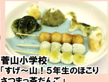
菅山小学校 「すげ～山！5年生のほごりさつまっ茶だんご」