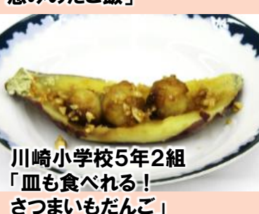
川崎小学校5年2組 「皿も食べれる！さつまいもだんご」