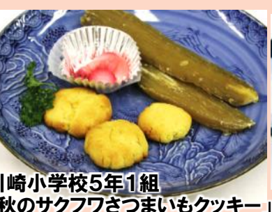
川崎小学校5年1組 「秋のサクフワさつまいもクッキー」