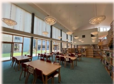
↑学園内の地域開放されている図書室