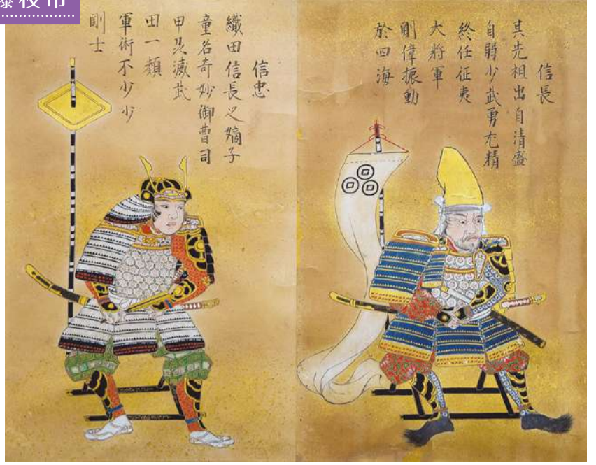
織田信長・信忠(泰巖歴史美術館)