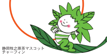
静岡牧之原茶マスコットキャラクター