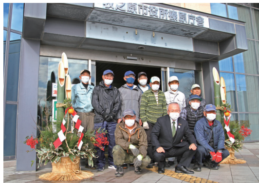
市役所庁舎に門松寄贈

詳しいセンターの情報や仕事の内容は、ホームページをご覧ください(「牧之原市シルバー人材センター」で検索できます)。