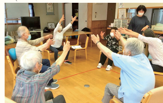
*理学療法士の個別指導があります。