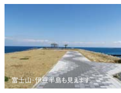
富士山・伊豆半島も見えます。