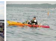
カヤック・フィッシング