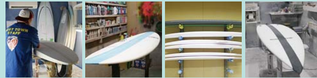
STEP.1 シェーピング >> STEP.2 カラー >> STEP.3 コーティング >> STEP.4 サANDING

牧之原市は、全国で3本の指に入るほどサーフショップの多い「サーフインの街」。サーフィンエキスパートがサーフショップを開いているため、ほとんどのお店でサーフボードを製作しています。好みのデザインや形(長さ・幅・厚み・フィンの数)、素材を選んでもらい、サーファーの体型やどのような波に乗るかなどを丁寧に聞き取り、サーフボードを製作しています。自分だけのオリジナルボードを作ってみてはいかがでしょうか。