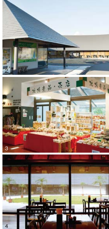
1.加水なしの源泉かけ流しの露天風呂。2.カーブを描く、独特な形状の建物。3.地場産品も販売しています。4.お食事処では、新鮮な食材を使った旬の料理を味わえます。