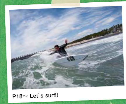
P18~ Let's surf!!