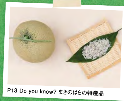
P13 Do you know? まきのはらの特産品