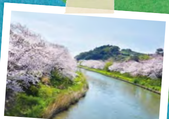
P30 おすすめモデルコース