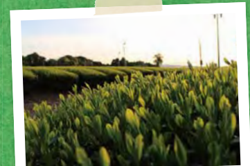
P04~ 牧之原の深蒸し茶