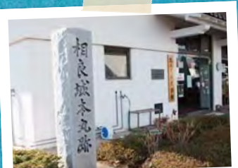
P24~ 牧之原の歴史を訪ねて。