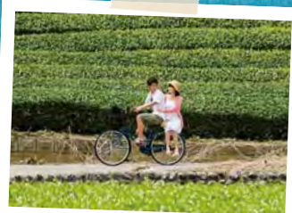
P14~ LOCATION TOUR OF MOVIE