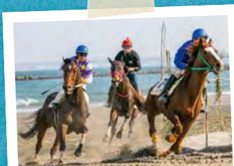
P28~ EVENT INFORMATION