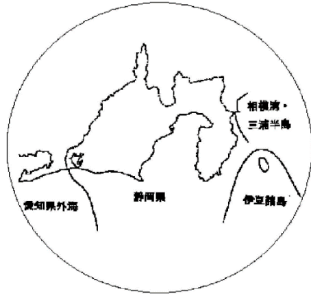
第1図 静岡県及び周辺の県が属する津波予報区