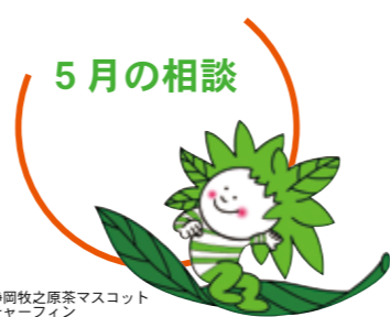
静岡牧之原茶マスケットチャーフイン

新型コロナウイルス感染症対策のため、マスクの着用と体温測定の実施にご理解、ご協力をお願いします。お出かけ前に、ご自宅で体温を測定し、37.5℃以上ある場合のほか、咳症状や倦怠感などがある場合は、相談を見合わせてください。