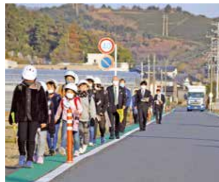
児童と一緒に歩いて効果を検証

令和3年6月に千葉県八街市で発生した、登下校中の子どもが犠牲となる交通事故を受け、市では同年7月から市内の通学路の合同点検を開始しました。このたび、点検の際に特に危険と判断された市道勝間田静波線について、グリーンベルトおよび車線分離標(ポール)の設置が完了し、3月11日には、川崎小学校の児童が通学路を歩く様子を点検しながら、その効果を検証しました。効果検証の後には完成式典が行われ、杉本市長が「今回整備した区間は、八街市の事故が発生した道と似ている。先ほど一緒に歩いた際、子どもに聞いたら『今まで